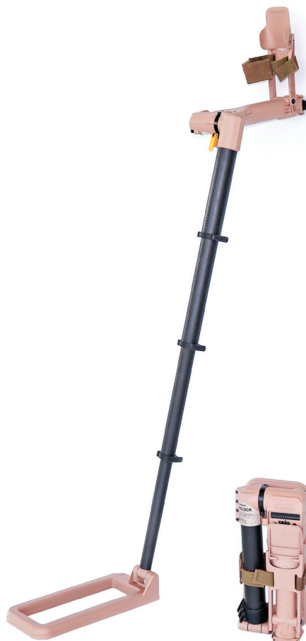
Wykrywacz min – dane techniczne